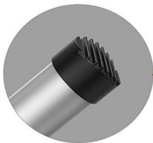
Non-slip foot cover