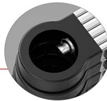
Safety lock slot